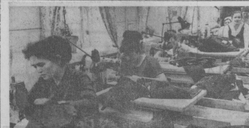
СУРАТДА: «Юлдуз» тикувчилик фирмасининг механизациялашган конвейер усулида костюм тикшиш участкаси.