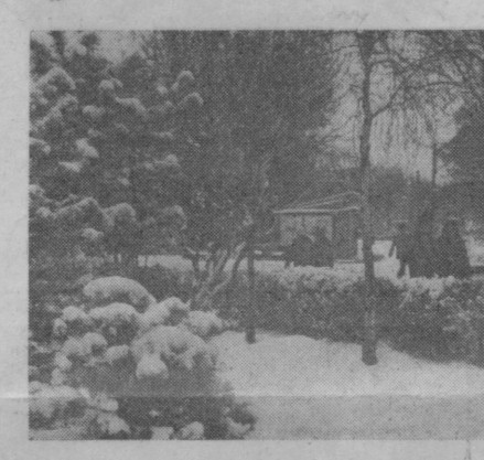
ШАХРИМИЗ ОППОҚ ҚОРГА БУРКАНДИ.

Юзасин қараганда бильярд соғқалари сатҳини дераза ойнасидек сип-силлиқ дейиш мумкин. Ҳақиқатдан шўндайми. Йўқ, албатта. Бильярд соғқалари ҳам чин гапни айтганда ер шарин кўрфасидек ўзгар-қўнқиланлардан иборат. Агар ушбу соғқаларни ер шарин ҳамкиден йириқлаштириш имкони бўлганда физикимизнинг яққол нотобини кўз билан кўриш мумкин эди. Тўғри, кўп вақтларгача каттик ҳолдаги сувнинг (қор, муз ва ҳонказо) бўғланиши мумкин эмас деб келинарди. Бу фикрга рус физиги В. Петров қарши чиқди. У қорнинг, ҳатто ҳаво ҳарорати ноль даражадан пастда бўлганда ҳам бўғланиш процесси юз беришини таъбирлар асосида исбот қилган. Қишда ҳатто, устма-уст ёққан қорни сичковлик билан қузашиб борган киши унинг қамайиб қолганини, сув бермасдан йўқолганини сезиши мумкин. Шуниси қизиқки, қорнинг бўғланиш процесси жадаллик билан бормайди. Тез суръат билан бормайди, эди, сув бермайдиган қор кишиларимизнинг бошига бир неча кўнглис воқеаларини туширган бўларди.