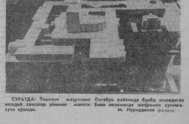
СУРАТДА: Тошкент шаҳрининг Октябрь районига бунёд этилган янги каравот заводи лойиҳасини ниятдоғи этказишди.

1971 йилда дастлабки маҳсулотни берадиган бу корхонада 450 киши ишлайди.