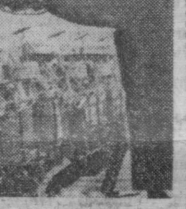
«Ўзбексельмаш» заводи бу йил ана шундай селкалардан 8 мингтаганин ишлаб чиқаради.