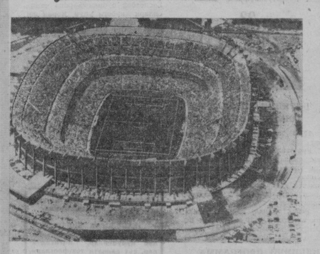
МЕХИКО. «Ацтек» стадиони. 1970 йил 31 майда СССР ва Мексика терма командаларининг матчи билан бу ерда футбол бўйича IX жаҳон биринчилиги учун кураш бошланди. Совет Иттифоқи командаси билан ўйнайдиган биринчи группа командалари, шунингдек ярим финал ва финалга чиққан командаларнинг бир қанча ўйинлари ана шу стадионда бўлди.

Бу ерда «Ленин ўқишлари» бошланди. Ана шу ўқишлар «Ленини яшаган, Ленин барҳаёт, Ленин яшайверди» шпори остида ўтмоқда. «Ленин ўқишлари» цикли ўн беш докладдан иборат бўлиб, улар орасида «Ленин — комму- нистик партиянинг асосчиси ва доҳийси», «Ленин — жаҳонда биринчи ишчи ва деҳқонлар давлатининг асосчиси», «Ленин ва миллий сибас масалалари», «Ленин ва социалистик давлат экономис» каби докладлар ҳам бор. «Ленинча яшаш ва ишлашни ўрганингиз» сарлавхали мақола босилиб чиқди. Мақолада бундай дейилади: «Бутун дунёдаги, шу жумладан араб мамлакатларидаги революцион кучлар В. И. Ленин туғилган кунининг 100 йиллигини тантанали нишонлашга ҳозирланмоқдалар. Улар юбилейни бундай нишонлаш давринингининг барча профессия талабалари билан — озодин, миллий мустиқлиқни ва социал адолат гоилар билан чамбарчас белгилашнинг деб билмоқдалар». Соф виждонли кишиларнинг ҳаммаси Ленин юбилейини кутиб олганга эр файр бади билан тайёргарлик кўраётган и к л а р и нинг сабаби шуки, деб даром қилади газетчи, В. И. Ленин гоилари ва ишлари миллий ва социал озодин учун, империализм ва аўлға қарши курашувчилар қалбида абадий яшайотиб келмоқда. Ленин гоиларининг ҳақонийлигини ва ҳаётлигини илҳом ишчилар ва миллий озодин ҳаракатининг тарихини исботлаб берди, дейлади мақолада. Мана шунинг ўзи Ленинни революцион пролетар курашчиси ва геннал мутафаккири деб билган ёш авлод орасида унинг гоилари айниқса кўпроқ тавафдорлар ва мухлисларни ўзига жалб қилмоқда.