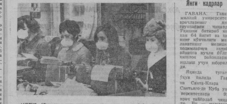
АНГЛИЯ. Юқумли грипп касаллиги авж олганлиги сабабли Лондондаги кўпгина ташкилот ва муассаса ларнинг ходимлари огиз-бурунларига ниқоб тутиб олишган.

СОФИЯ. Шу йилнинг биринчи кварталда Болгария Чехословакияга тузиб пайтларда, яқинба ва байрам кунлари 70 миллион киловатт соат электр энергия ет-риб туради. БТА агентлигининг хабарига айтилишича, бундан бунён Болгариядан етказиб бериладиган электр энергиянинг миқдори 300 миллион киловатт соатга етказилади. (ТАСС).