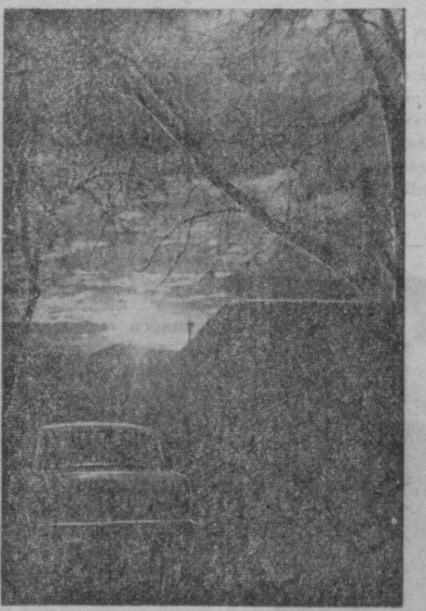
ШАҲРИМИЗ ТОНГИ.

Одамлар метро вагонларида, автобусларида ва таксиларида нималарни унутиб қолдиришмайди. Булар орасида портфеллар, соябонлар, китоблар ва ҳоназоларни учратиб мумкин.