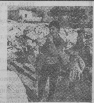
Исроил ҳарбийлари Иорданиянинг тиҷ аҳоли-сига қарши репрессияни кучайтирмоқдалар. СУРАТДА: Женини шаҳри яқиндаги қишлоқлардан бирида исроилликлар вайрон қилган уйнинг кўриниши.

БАЙРУТ. «Аннидо» газетасида «Ленини ўқингиз», «Ленинча яшаш ва ишлашни ўрганингиз» сарлавхали мақола босилиб чиқди. Мақолада бундай дейилади: «Бутун дунёдаги, шу жумладан араб мамлакатларидаги революцион кучлар В. И. Ленин туғилган кунининг 100 йиллигини тантанали нишонлашга ҳозирланмоқдалар. Улар юбилейни бундай нишонлаш давринингининг барча профессия талабалари билан — озодин, миллий мустиқлиқни ва социал адолат гоилар билан чамбарчас белгилашнинг деб билмоқдалар». Соф виждонли кишиларнинг ҳаммаси Ленин юбилейини кутиб олганга эр файр бади билан тайёргарлик кўраётган и к л а р и нинг сабаби шуки, деб даром қилади газетчи, В. И. Ленин гоилари ва ишлари миллий ва социал озодин учун, империализм ва аўлға қарши курашувчилар қалбида абадий яшайотиб келмоқда. Ленин гоиларининг ҳақонийлигини ва ҳаётлигини илҳом ишчилар ва миллий озодин ҳаракатининг тарихини исботлаб берди, дейлади мақолада. Мана шунинг ўзи Ленинни революцион пролетар курашчиси ва геннал мутафаккири деб билган ёш авлод орасида унинг гоилари айниқса кўпроқ тавафдорлар ва мухлисларни ўзига жалб қилмоқда.