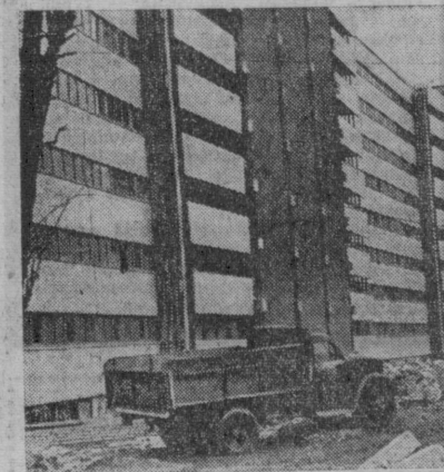
Қардош қурувчилар шахримизда барпо қилган янги чиройли бинолар совет кишиларининг бир-бирга меҳри, қардош халқлар дўстлигини рамзи бўлиб қолди. Сиз суратда кўриб турган бу улкан бино ҳам Ленин орденли «Главмострой» бинокорларининг тошкентликларга совғасидир. «Марказ-1» микрорайонида қурилган бу бино 250 хонадонни мамнун этади.

Фабрика меҳнат аҳли 1969 йилда баракали меҳнат қилиб, йиллик плани мунтазам ярим ой илгари адо этди ва планга қўшимча 528 минг сўмлик маҳсулот реализация қилди. Корхона ишчилари, инженер-техник ходимлари ва хизматчилари социалистик муСОБАҚАНИ қилиб, ички резервларини ишга солиб Бекободдаги В. И. Ленин номи ме-