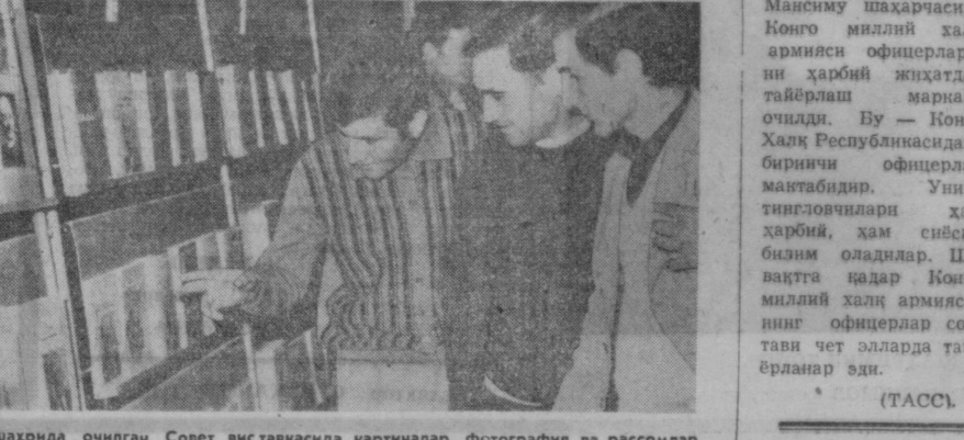
ЛИВАН. Сайд шаҳрида очилган Совет виставкасида картиналар, фотография ва рассомлар ишлаган асарлар намойиш қилинмоқда. В. И. Ленинга бағишлаб чиқарилган совет маршаларининг коллекцияси маҳаллий филателистларда катта қизиқиш уяғотди. СУРАТДА: Ленин асарларига бағишланган стендинг кўриниши.

БЕРЛИН. Германия Демократик Республикаси соғлиқни сақлаш министрлигининг хабар қилишича, кейинги кунларда мамлакатда грипп касаллиги тарқалган. Эрфурт, Зүль, Галле, Шверин округларида ва Франк Фурт—Одерда айниқса кўп киши грипп билан орган. Грипп билан курашмоқ учун, дейлади хабарда, кенг кўламда профилактика тадбирлари ўтказилмоқда, қизил крест ташкилотлари медицина ходимларига катта ёрдам бермоқда. ГАРБИЙ БЕРЛИН. Соғлиқни сақлаш масалалари билан шуғулланувчи бошқарманин матбуотда эълон қилинган маълумотларига қараганда, ГАРБИЙ Берлинда 96 киши гриппдан ўлган. Соғлиқни сақлаш масалалари билан шуғулланувчи сенатор Бодин грипп касаллигининг тарқалиш тўққини шаҳар аҳолисига медицина хизмати кўрсатишда «нуқсонларни очиб кўрсатди» деб эътироф қилди. (ТАСС).