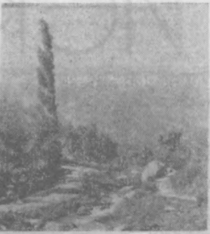
БЫСТРО НЕСЕТ СВОИ ВОДЫ КАРА-УНГУРА В ЮЖНОМ КИРГИЗИИ