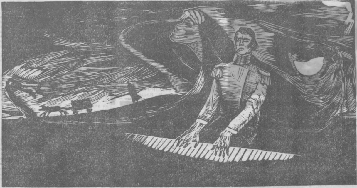
«...Мне очень нравится полонез Огиньского, но я ничего не знаю о композитере. Я долго искал какую-нибудь литературу о жизни и творчестве автора знаменитого полонеза «Прощание с Родиною»...

Сивозь ветви густолиственного тала Не мог пробиться лисий лунный свет.