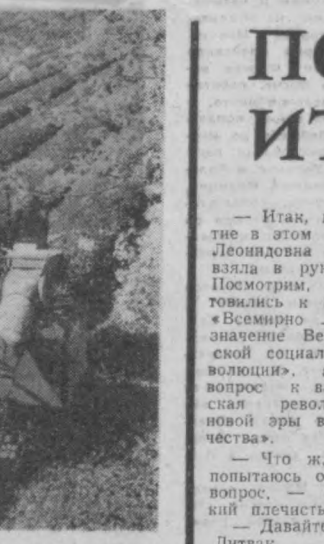
В хозяйствах Абхазии начался выборочный сбор зеленого чайного листа. Чаеводом Московского совхоза предостант собрать 1600 тонн сырья. НА СНИМКЕ: механизированный сбор чайного листа.