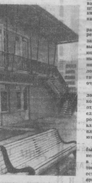
НА СНИМКЕ: здание детского сада с солнцезащитным устройством.

Таким образом, до того, чтобы наше жилище получало, наконец, один из самых необходимых в условиях Средней Азии элементов комфорта — солнцезащиту, осталось сделать последний шаг — организовать производство соответствующих солнцезащитных устройств.