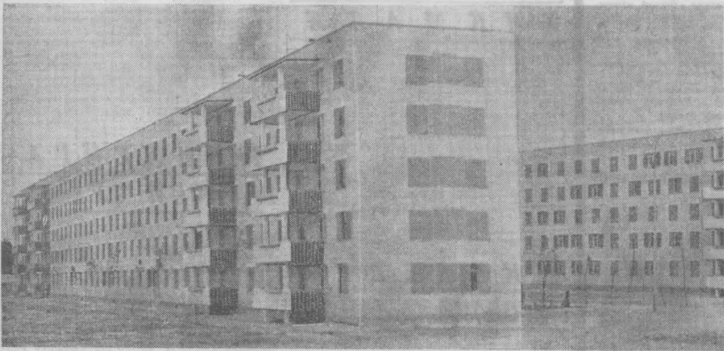
Ленин орденли «Главенгипроградстрой» қурувчилари Чилонзорнинг 25-микрорайонидagi ҳар бири 100 квартиралли 2 янги ўйин фойдаланишга топшириш учун тайёрландилар. СУРАТДА: ленинградлик бинокорлар қурган янги уйлар.