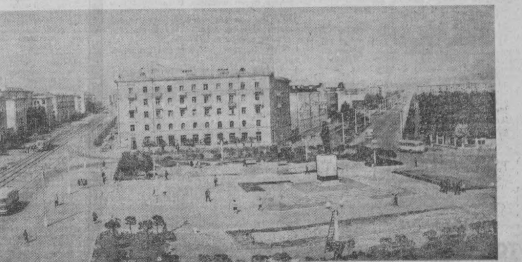
ХАБАРОВСК УЛКАСИ, БУНДАН 35 ЙИЛ МУҚАДДАМ ХУДДИ ШУ ЖОЙДА АСРЛАР БУЙИ УСИБ ЕТГАН ТАЙГА МАВЖУДЭДИ. АМУРДАГИ БУГУНГИ КОМСОМОЛЬСК ШАҲРИНИНГ ЗАМОНАВИЙ БИНОЛАРИДА ҲОЗИР 200 МИНГ АҲОЛИ ЯШАМОҚДА. СУРАТДА: В. И. ЛЕНИН НОМИЛИ МАЙДОН ТАСВИРЛАНГАН.