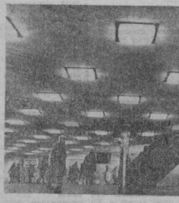
Бу ер ости ўтиш жойи Будапештнинг Шарқий воқоли яқинида қурилган. Похта минероли, теги биринчи набатининг қурилиши муносибати билан Барош майдони ҳам реконструкция қилинмоқда.

80 йилга қамашга ҳўм қилган эдиклар. Бу сафар Вилли қочиб қутула олмади. Эхтимол бу гапга ақволдан хайратда қолган маъмулар қартириш ҳақида қарор қилган бўлсалар керак ва 17 йил қамоқда ётган 68 ушар ўғри янги йилга уч кун қолганда қамолдан чиқди.