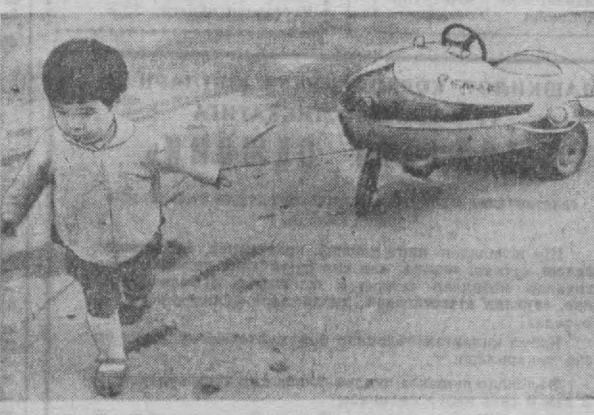
«Бир ўйнаб келай».