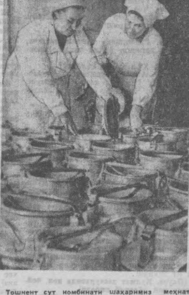
Тошкент сўт комбинати шаҳарини меҳнатнашлари учун кўнига 21 хил сўт, қаймоқ, натиқ, сариг ағ, сузма каби махсулотларни ишлаб чикарайтир.

Бундан ташқари, тўйгача яна икки қаватли турар жой биносини қуришни ҳам планлаштирганмиз. Бу тўйга қичиб бўлса ҳам тўёнмиз бўлади. С. МАТЧАНОВ.