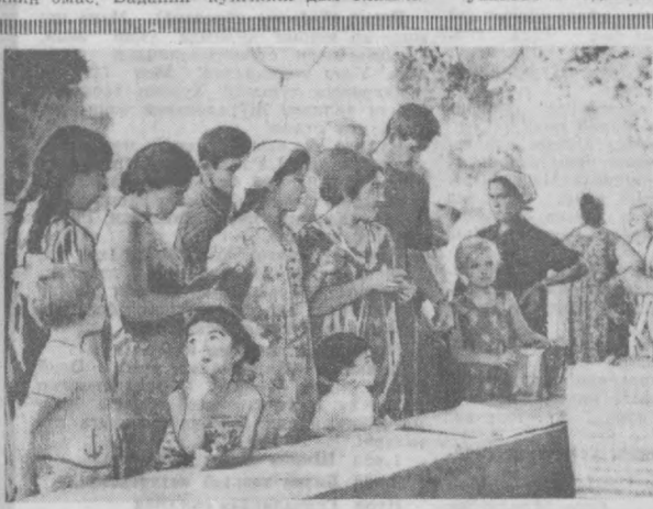
Пойтахтимизнинг сивер ва хиёбонларида сотилаётган учар пуфаклар кўнвоқ ёшларни ўзига мадун этмоқда.