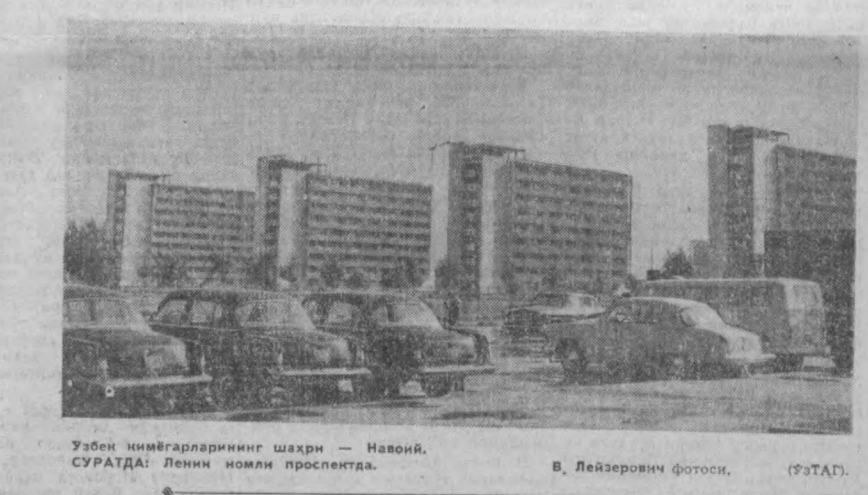
Ўзбек индустрияларининг шаҳри — Навоий. СУРАТДА: Ленин номи проспектида. В. Лейзервич фотоси, (ЎзТАГ).