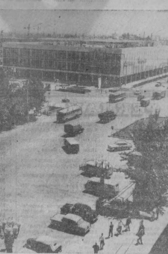
СУРАТДА: республикадаги энг йирик савдо тармоғи — Марказий универсал магазиннинг кўрinishи.