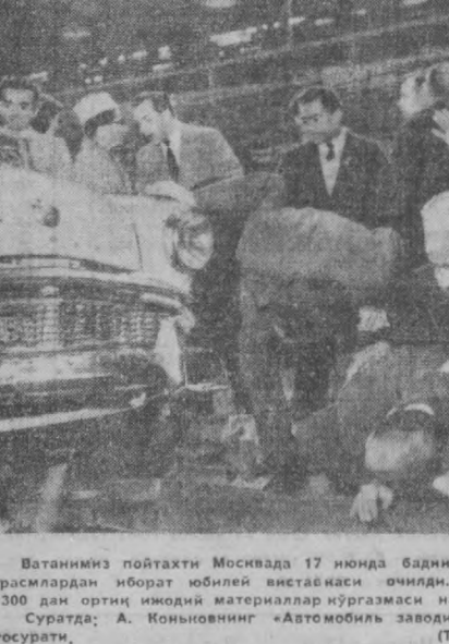
Ватанимиз пойтахти Москвада 17 июнда бадий ва ҳужжатли фото-расмлардан иборат юбилей виставаси очилди.