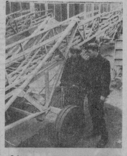
«Ўзбекистон» пахтачилик машинасозлиги заводда қишлоқ хўжалик машиналари билан бир қаторда кўплақ турли хил механизмлар тайёрланмоқда. СУРАТДА: пахтачилик учун тайёрланган механизмлар ва мосламалар жунатилиш олдидан.

Республика халқ хўжалик ютуқлари кўрғазмаси кейинги пайтларда чет эллик меҳмонларнинг диққатини жалб қилмоқда. Монголия Халқ Республикаси соғлиқни сақлаш ходимлари делегациясига бир ердга барча экспонатлар манзур бўлди. Польша, Руминия, Югославия, Австрия, АҚШдан келган меҳмонлар ҳам кўрғазмада бўлиб, катта таассурот олдилар.