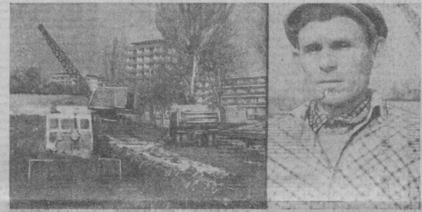
40 та рационализиаторлик тақлифини жорий этишдан 50 минг сўм иқтисодий фойда олишга эришиш.

Конструкторлик бюроси ижодкорлари кўриқ ерларни ўзлаштирувчиларнинг оғирини енгил қиладиган янги машина яратдилар. Елик дренажларини тиккасига қавлайдиган «ПДГ-125» маркали машинанинг дастлабки намуналари сновдан ўтиб, ишлаб чиқаришга жорий этилмоқда.