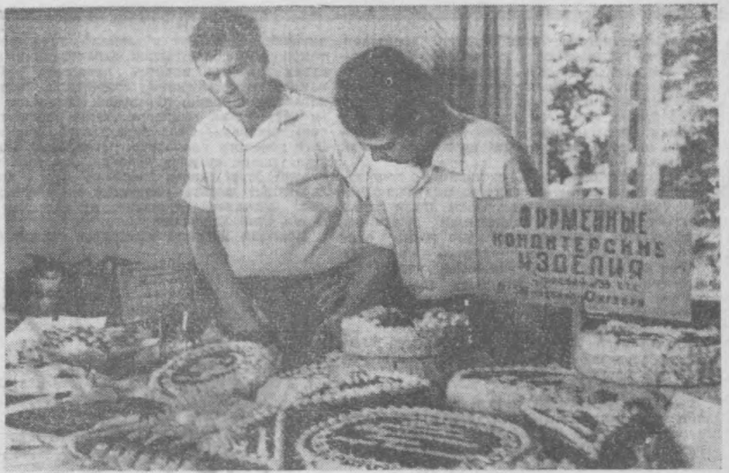
Куйбешев ошхоналар трестига қарашли «Масаллиқлар» фабрикаси ва 33-ошхона қандолатчилари хар кун пойтахт аҳолиси учун аjoyиб ҳамда ранг-баранг торт, пирожний ва шу наби бошқа кўпгина кондитер маҳсулотларини тайёрлайдилар. Бу ерда «нобиля ва гуламбар» деб аталувчи аjoyиб торт ва пирожнийларни истаган миқдорда харид этиш ҳам мумкин.

Хас-чўп мағрур денгиз мавжиде, Оқиб борар эди узокка, Ногоҳ кўзгаб тўлиқ газаби.