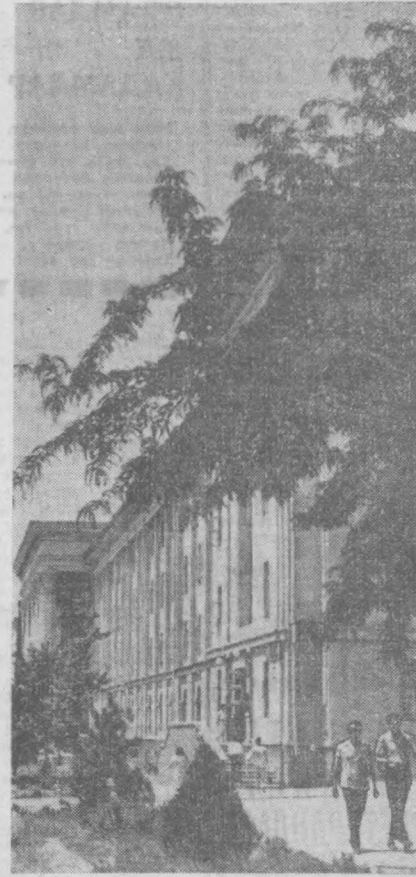
Тошкентнинг Навоий кўчасида.