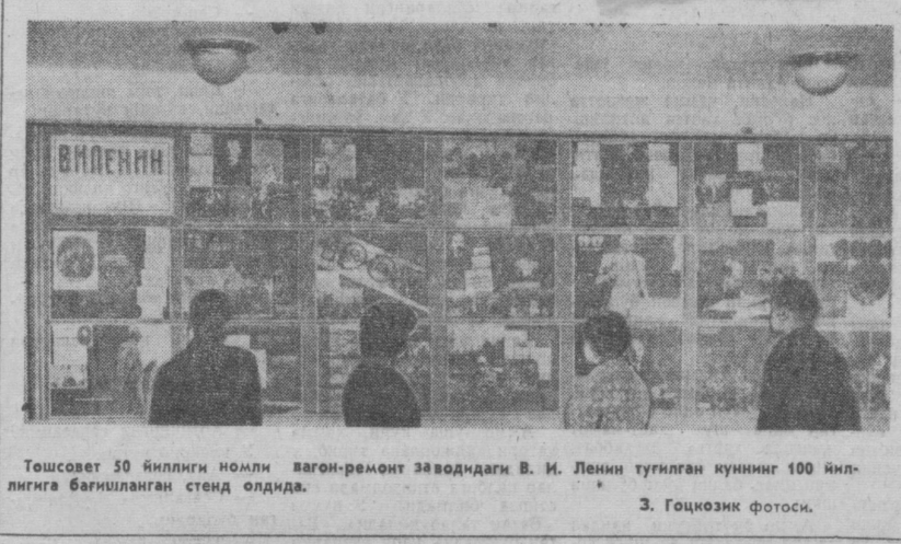
Тошсовет 50 йиллиги номли вагон-ремонт заводидagi В. И. Ленин тугилган кунининг 100 йиллигига бағишланган стенд олдида.