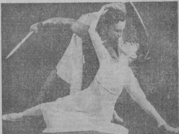
СУРАТДА: Алишер Навоий номидаги Давлат академик опера ва балет Катта театрининг «Спартак» балетидан кўриниш.