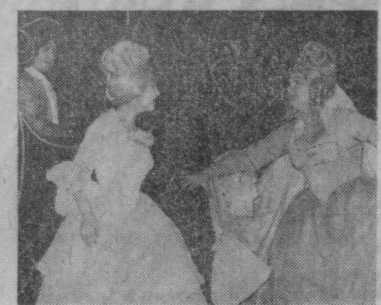
Тошкент театрларида турли асарлар сахна юлдузи бўлиб келмоқда.

СУРАТЛАРДА: Муқимий номидаги музикали театрнинг «Паранжик сирлари», «Еш гвардия» театрнинг «Осенцим жаллодлари», Ҳамза номидаги ўзбек давлат академик театрнинг «Бой ила хизматчи», Горький номидаги рус академик драма театрнинг «Қасос ёши», рус ёш томошабинлар театрнинг «Золушка» асарларидан кўринишлар тасвирланган.