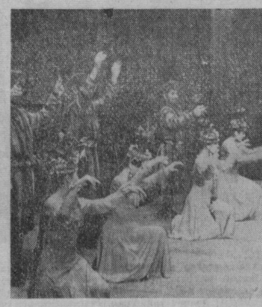
СУРАТДА: ўзбек Давлат филармонияси шоши-даги «Лазги» ансамбли раис ижро этмоқда