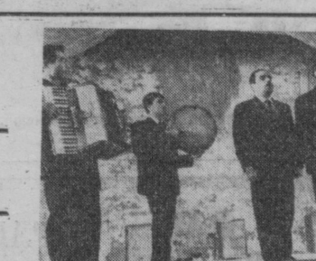
Бирлашган Араб Республикасида келган бир гурупа студент ва аспирантлар «Менинг Ватаним» кўшигини ижро этмоқдалар.

кийимлари тикиш бўйича янги модалар фабрика бадийи советида юқори баҳоланди. Бу модалар асосида мавсумий жуда чиройли ва ихчам трикотаж кийимлари тикилади. Кийим юпка, икчам ва чиройли бўлади. Модаларнинг ишлаб чиқаришга тўла жоғрий қилиниши туфайли бир тонна маҳсулот ёки 27 минг сўм тежалади.