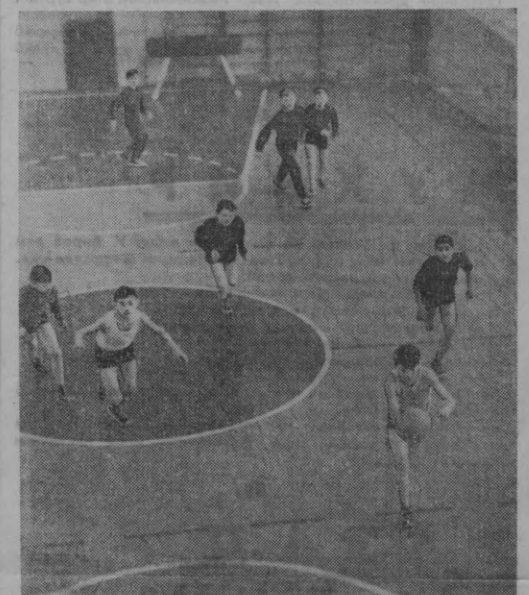
СУРАТДА: Тошкент темирўли қошидаги ёшлар спорт мактабининг ёш баскетболчилари тренировка машғулотларида.

Москвада 8—11 июлда байдарка ва каноэ эшиш бўйича арканлар ва аёллар ўртасида, 29 июль—3 августда велосипед спорти бўйича (шоссе пойга), 11—25 июлда кўп кумли пойга бўйича, 11—22 июлда арканлар ва аёллар ўртасида волейбол бўйича, 17—28 июлда теннис бўйича команда мусобақалари, 29 июль—5 августда теннис бўйича шахсий биринчилик мусобақалари, 20—23 июлда арканлар ўртасида андемик эшик эшиш бўйича, 21—31 июлда Ленинград шаҳрида елка спорт бўйича, 22—30 июлда Москва шаҳрида чамадолик бўйича, 22—27 июлда замонавий бешкураш бўйича, 24—31 июлда спорт гимнастикаси бўйича, 24—30 июлда енгил атлетика бўйича, 24 июль—5 августда қиличболик бўйича, 24 июль—4 августда шахмат бўйича, 25 июль—4 августда баскетбол бўйича, 25—29 июлда классик кураш бўйича, 25 июль—4 августда суз пелоси бўйича, 25 июль—3 августда нишонга отиш бўйича, 27 июль—5 августда сузич бўйича, 27 июль—5 августда оғир атлетика бўйича, 28 июль—4 августда бокс бўйича, 28 июль—3 августда велосипед спорти бўйича (трекда пойга мусобақалари), 29 июль—2 августда эркин кураш бўйича, 29 июль—4 августда сува сакраш бўйича, 29 июль—1 августда мерганлик, овчилик бўйича мусобақалар ўтказилди.