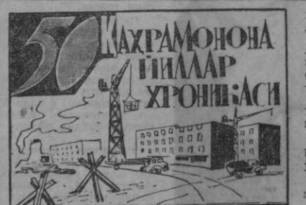
МАХРАМОНОНА ПИЛЛАР ХРОНИКАСИ

1958 йил 5 СЕНТЯБРЬ. Тошкентда Узбекистон рацонализиаторлари ва иқтиросчиларининг биринчи республика конференцияси очилди. 8-10 СЕНТЯБРЬ. Тошкентда бадий агентбригадаларининг иккинчи республика кўриги бўлиб ўтди. 15 СЕНТЯБРЬ. Тошкентда Узбекистон медицина ходимларининг IV съезди ўз иштини бошлади. 3 ОКТЯБРЬ. Янги «Тошкент» меҳмонхонаси биринчи меҳмонлар—Осиё ва Африка мамлакатлари ёзувчилари конференция катташчиларини қабул қилди. 7-13 ОКТЯБРЬ. Тошкентда Осиё ва Африка мамлакатлари ёзувчиларининг конференцияси бўлиб ўтди. Конференция ишида 30 мамлакатдан 185 делегат қатнашди. 14-15 ОКТЯБРЬ. Узбекистон ёзувчиларининг IV съезди бўлиб ўтди. 19 ОКТЯБРЬ. Алишер Навоий номи опера ва балет театрида «Зайнаб ва Омон» операсининг премьераси бўлиб ўтди. 27 ОКТЯБРЬ. Узбекистон ЛКСМ Марказий Комитети, Тошкент обалта ва шаҳар комсомол комитетларининг ВЛКСМ нинг 40 йиллигини бағишланган тантанали пленуми бўлиб ўтди. 29 ОКТЯБРЬ. Қўдон шаҳрида босмачилар