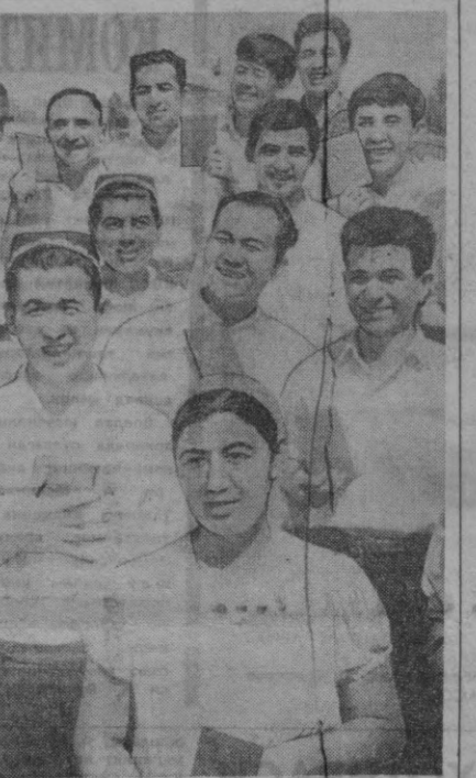
Бу йил—Тошкент кишлоқ хўжалик институтининг 600 дан ортиқ мутахассислари тайёрлаб чиқаради. Уларнинг кўпчилиги республикамизда янги тузилган совхозларда ишлашадилар. Сўрада: агрономия факультетини тугатган студентлардан бир гуруҳлики.

Тошкентдаги Чилонзор савдо марказини «Гастроном» республика котиросини, «Узбекистон» ва «Узветгаз» республика базаси ҳам Марказий универсал билан бир қаторида планлаштириш ҳамда хўжалик фаолияти натижаларига баҳо беришнинг янги тартибига ўтишди. Узбекистон ССР Савдо министрлиги ана шу ташаббусини маъқуллаб, унга кенг йўл очиб беришга қарор қилди. Министрлининг буйруғига мувофиқ, икки мингдан кўпроқ магазин ва қарийб 500 та умумовқатланган корхонаси ишнинг янги системасига ўтказилди. (ЎЗАТ).