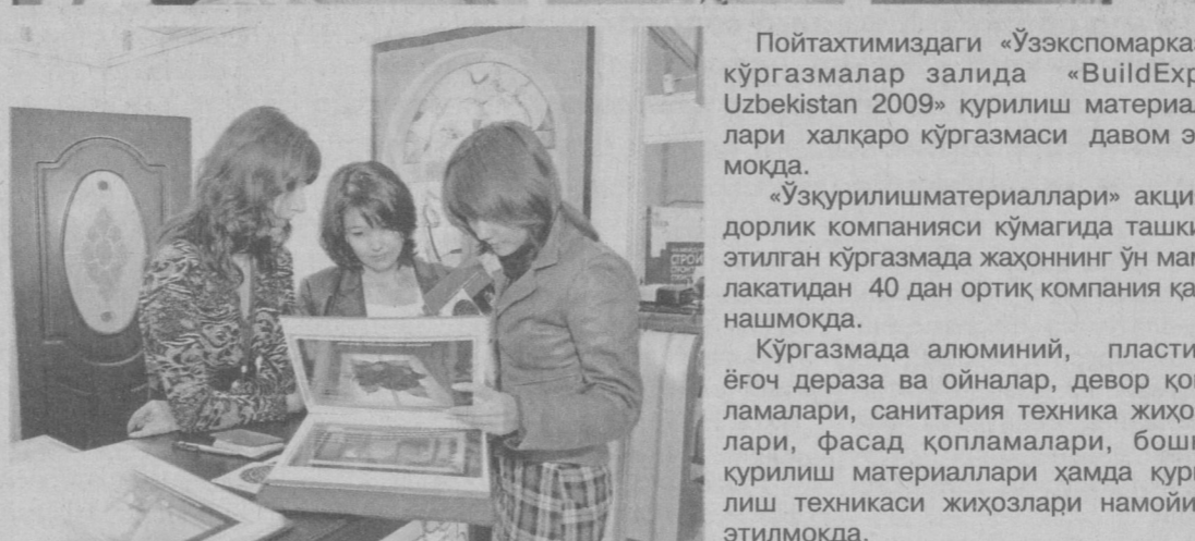
СУРАТЛАРДА: кўргазмадан лавҳалар