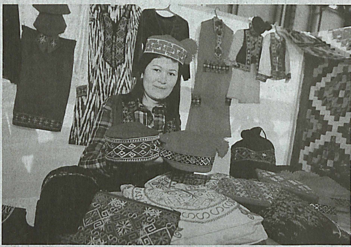
В Нукусе прошла выставка продукции молодых предпринимателей, ремесленников и фермеров "Молодежь - создатель будущего".

В Республике Каракалпакстан ведут деятельность более 5,5 тысячи фермерских хозяйств, свыше 570 из которых руководят молодые фермеры. Порядка пяти тысяч молодых предпринимателей ведут успешную деятельность в различных сферах и вносят достойный вклад в укрепление экономики страны.