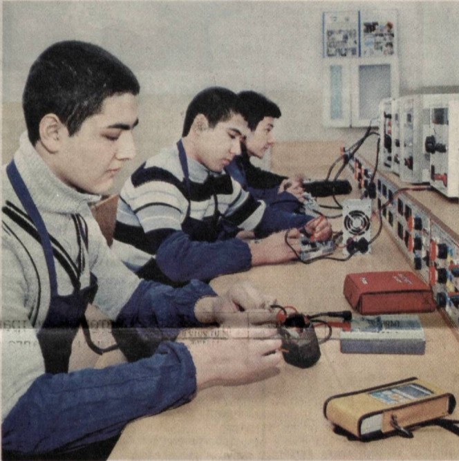
СУРАТДА: Юнусобод машинасозлик касб-ҳунар коллежи ўқувчилари амалий машғулотда.

Юнусобод машинасозлик касб-ҳунар коллежида автомобилларга техник хизмат кўрсатиш бўйича техник механик, кенг ассортиментдаги кийимлар модельер-конструктори, автоматика воситалари ва назорат ўлчов асбобларини монтаж қилиш, ишлаш ва хизмат кўрсатиш техник, пайвандлаш жиҳозлари механиги, маиший хизмат техникаси ва касса аппаратларини таъмирлаш бўйича уста, бағалтер, молячи, автомобиль электр ва электрон жиҳозлари диагностикаси техникни, маиший хизмат машиналарини таъмирлаш, компьютер тармоқларини монтаж қилиш ва таъмирлаш каби йўналишлар бўйича мутахассислар тайёрланади. Коллежда ўқув ва лаборатория хоналари, ахборот-ресурс маркази, амалиёт учун мўлжалланган устaxonалар ўқувчилар ихтиёрида.