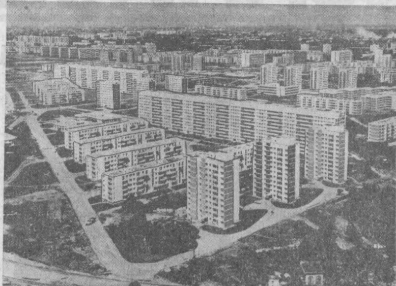
РУМИНИЯ СОЦИАЛИСТИК РЕСПУБЛИКАСИ. БУХАРЕСТ. МИЛITАРЬ РАЙОНИДАГИ ЯНГИ ТУ-РАР-ЖОЙ ВИНОЛАРИ.

Эртага—4 февралда СССР билан Руминия ўртасида дўстлик, ҳамкорлик ва ўзаро ёрдам тўғрисида шартнома имзоланганига 20 йил тўлади