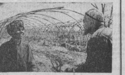
Суратларда ана шу фильмдан кадрлар.