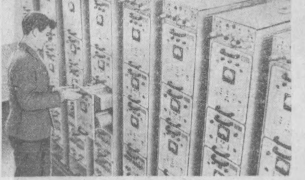
Янги радио телефон аппаратурасини монтаж қилиш пойтахтидаги шаҳарлараро телефон станциясида бошланди. Москва ва Киев шаҳарларидан кейин Тошкент тўғриван тўғри телефон алоқаси ўрнатилган учинчи шаҳардир. Шу нуналда 300 та аппарат қабул қилинди. Бу аппаратлар такси, тез ердан машинаси ва ёнгили учирини машиналарига ўрнатилди. Машинада утирган пассажир йўл-йўналиш шаҳарнинг хоҳлаган қисми билан телефон орқали гаплаша олади. СУРАТДА: марказий телефон станциясидаги телефон алоқаси

ЎЗБЕКИСТОН КП ТОШКЕНТ ШАҲАР КОМИТЕТИ ВА ТОШКЕНТ ШАҲАР СОВЕТИНИНГ ОРГАНИ