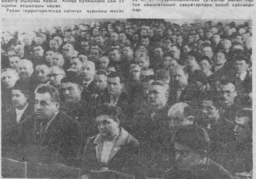
СУРАТДА: КОНФЕРЕНЦИЯ ЗАЛИДА.

Конференцияда район партия ташкилотларини ишлаб чиқариш қувватини тўла ишга солишга чакирди. Докладчи ва музокарага чиққан делегатлар сўзиди шаҳар хўжалиги, транспорт ишини яхшилашга катта эътибор берилди. Район территорияси ўнлаб километрга мўзилган. Минглаб меҳнаткашлар иш кўчи трамвай, автобус, троллейбусларга тушиш билан бошланади. Агар шаҳар транспорти бир мейерда ишласа, ишчи ёки хизматчи ўз ишига кўнгли хуш бўлиб келади, унинг меҳнат унумдорлиги ҳам юксак бўлади. Кўпчилик ҳолларда эса бунинг аксини кўряпмиз. Шунинг учун ҳам аҳолига транспорт хизмати кўрсатиш юзасидан кечиктириб бўлмайдиган тадбирларни амалга ошириш лозим. Алоҳа бўлимлари ҳам ўз ишини яхшилаши керак. Район территориясиди капитал курилиш юксак