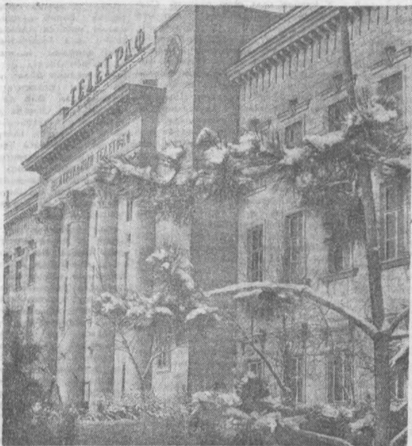
СУРАТДА: шаҳримиздаги Марказий телеграф биносининг кўриниши.

Ўзбекистон ССР Олий ва ўрта махсус таълим министрлигининг ўқув-методика кабинети ташкил қилган семинар қатнашчилари пойтахтнинг кўпгина қурилиш майдонларида бўлдилар.