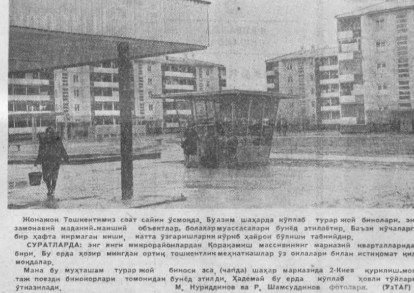
Жонжон Тошкентимиз соат сайин ўсмонда, Буазим шаҳарда кўплаб турар жой бинолари, энг замонавий маданий-маиший объектлар, болалар муассасалари бунёд этилаётир. Базин кўчаларда бир ҳафта кирмаган киши, катта узғаришларни кўриб ҳайрон бўлиши таъбириндир.

АҲОЛИ ТАЛАБИ БИЛАН Марказий универсал магазини атрофидаги Марказ-7 да ўндан ортиқ уйлар қурилади. Қардош украинлар бунёд этган бу уйларда икки мингдан ортиқ аҳоли истиқомат қилмоқда.