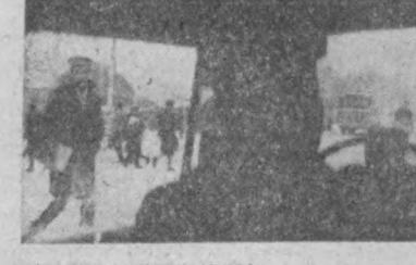
Г. Пун фотоси (ЭТАП).

«ВЕЧЕРНИЙ ТАШКЕНТ» орган Ташкентского Горкома КП Узбекистана и Ташхорсоевета.