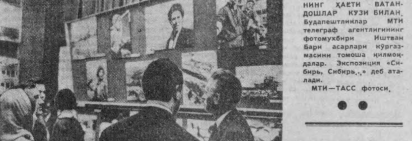
Совет кишилари- нинг ҳаёти ватан- дошлар кузи билан...