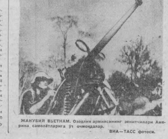
ЖАНУБИЙ ВЬЕТНАМ. Озодлик армиясининг ээнтчилари Америка самолётларига ўт очмоқдалар.