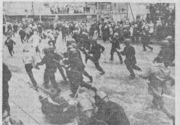
Япония Социалистик ва Коммунистик партияларининг ҳамда насаба союзлари бош Советининг чакирғига...