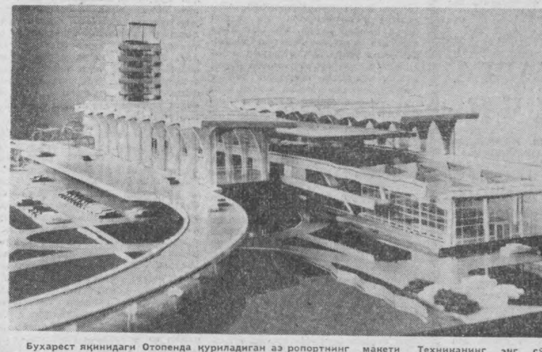
Бухарест яқинидаги Отопенда курилган аз ропортнинг манети. Техниканиннг энг сўнгги ютуқлари билан барпо этилган янги вокзал Руминия пойтахти ҳаво алоқаларини турт марта ошириш имконини беради. Бу ерда ҳар бир соат да 40 самолёт кўниб учеди. Учин ва кўниш майдони 3500 метрдан иборат бўлиб, ҳар қандай транспорт самолётини қабул қила олади. Курилиш 1969 йилда тавомиланади.

Куйбишев район ошхоналар трести аҳоли талабини бажо келтириш учун бир қатор тадбирларни амалга оширмоқда.