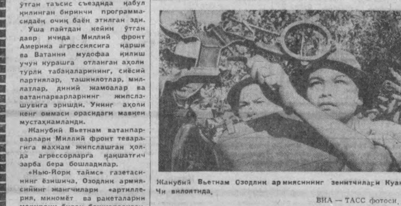
Жанубий Вьетнам Озодлик армиясининг зенитчилари Куанг Чи вилоятида.