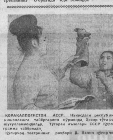
ҚОРАҚАЛПОҒИСТОН АССР. Нукусдаги республика Пионерлар саройи ўзининг йилнинг ишонилга тайёргарлик кўрмоқда...