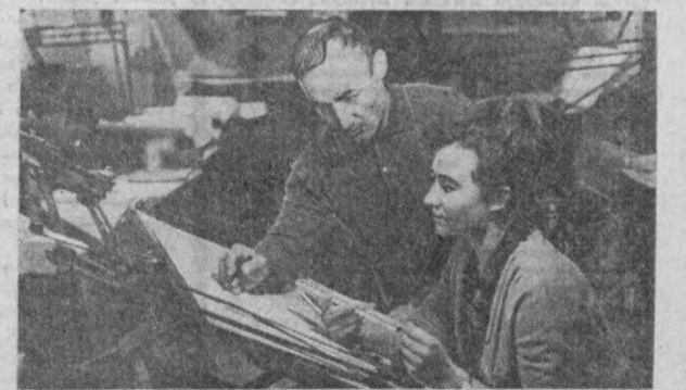
«Узгипроводхоз» институтининг насос станциялари бўлимида республикада насослар ердами билан сугорилдидаги кўпгина ирригация иншоотларининг лойиҳалари тайёрланмоқда.

Бригада аъзолари меҳнатда ўрнат курсатганликлари учун коммунистик меҳнат бригадаси деган муборак номни олишди.