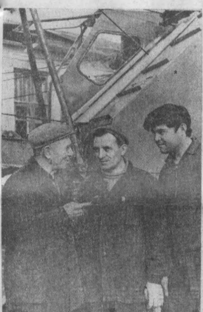
Тошкент эксаватор заводининг машинасозлари беш йиллик топириқларини муддатидан илгари адо этиш мақсадида мардонвор меҳнат қилаётганлар.

ЎЗБЕКИСТОН КП ТОШКЕНТ ШАҲАР КОМИТЕТИ ВА ТОШКЕНТ ШАҲАР СОВЕТИНИНГ ОРГАНИ