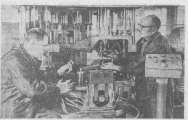
Ильич номи таърибда механика заводда 24 шпинделли резба очмадан станом яратилди. Янги станомнинг ишчилари завод инженер-техниклари тайёрлашди. Бу дастгоҳ «Чирчиксельмаш» заводда ишлатилди. Дастгоҳда бир йўла 8 детални ишлаш мумкин.

Цехдан чиққан бу ишчилар бироз ҳордиқ чиқариш маънасида ҳовли территориясига қўйилган скамейнага бориб ўтиришди. Гапдан гап чиқиб ана завод ишлари ҳақида баҳс кетди.