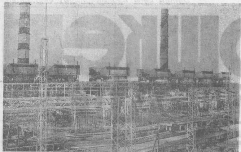
Тошкент ГРЭСи республикадаги йиллик энергетика ишчиларидан биридир. Ҳозир бу ерда янги энергетик ишлаб турибди. Навбатдаги 108 минг киловатт кубват берувчи 8-блок, 9-блочнинг сув омборини бунёд қилиш ишлари олиб бориляпти.