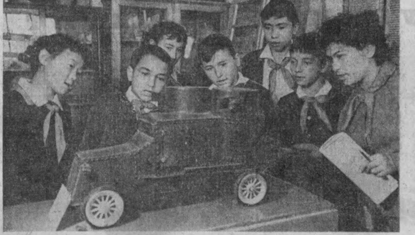
САМАРҚАНД б.мантаб ўқувчилари улуг доҳим В. И. Ленин нутқи мақолини яратдишди. Бу нодир манет мактаб томога йанга ўрнатилган. СУРАТДА: ўқувчилар броновик макетини кўр шаб олганган.