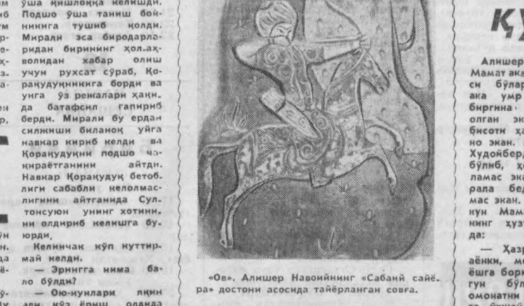
«О», Алишер Навоийнинг «Сабаний сайёра» достони асосида тайёрланган соғга.

Алишер Навоийнинг Мамаат ака деган қўшнис билан экан. Мамаат ака ур бўйи ишлаб, биргина тум ёптириб олган экан, холос. Бор бисоти ҳам аша шу бо экан. Мамаат аканинг Худойберди деган ўғли бўлиб, ҳеч қаерда иш-ламас экан, туну-кун тарала бедоддан бўшмас экан. Кунлардан бир кун Мамаат ака Навоийнинг ҳўзурига келибди: — Ҳазрат, ўзингизга айни, мен ача-муна ёшга бориб қолдим. Бу гун бўлмасам, эртанга омонатини топширадиганга ўхшайман. Сизга айтадиган бир илтимосим бор, ҳўп дасангиз, айтмай, — дебди. Навоий: — Бажонидил, бажарурмен, — дебди. — Илтимосим шулки, — сўзини давом эттирибди Мамаат ака, — мен бу дунёдан қў юзган кунимқо боласи тушмагур Худойберди қулганимни сотадиган қўрамади. Нима қилиб бўлса ҳам уни сотишга йўл қўймасангиз. Ахир: «Ватан гадоси — нафган гадоси», — деб бекор айтмаган. Мендан кейин Худойбердининг бундан унинг тиклаб олишга ҳеч бир ишонмайман. Худойберди қўрага қўйиб, ҳалок бўлади. Мамаат ака шундай дебди-да, қўзига жўққа ёш олибди. Навоий: «Айтганингиз бўлади, менга ишонинг», — деб уни юпатибди. Мамаат ака уйига келиб ўғлини олди-да чўкиртирибди: