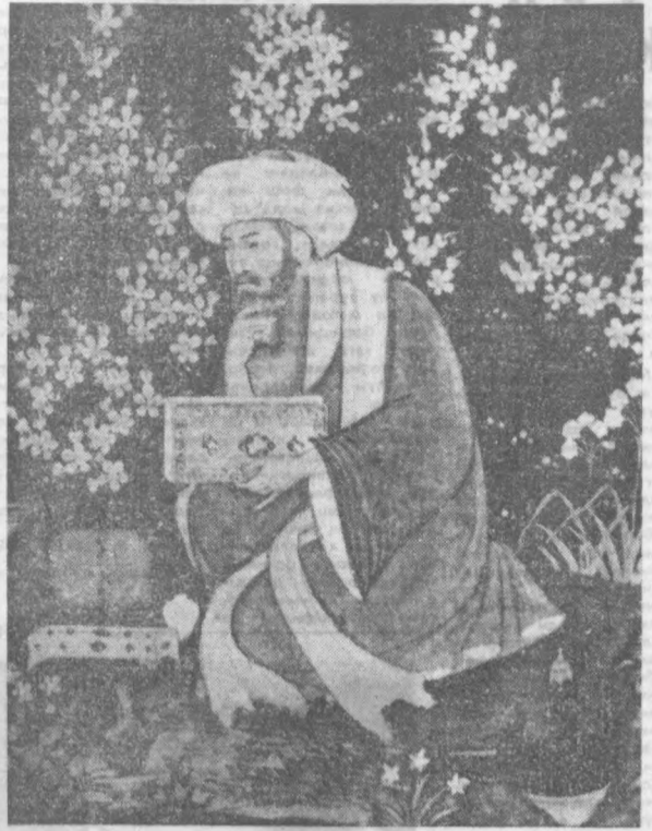
Шоирнинг 1630 йилда ишланган портрети. (Мугил мантаби).