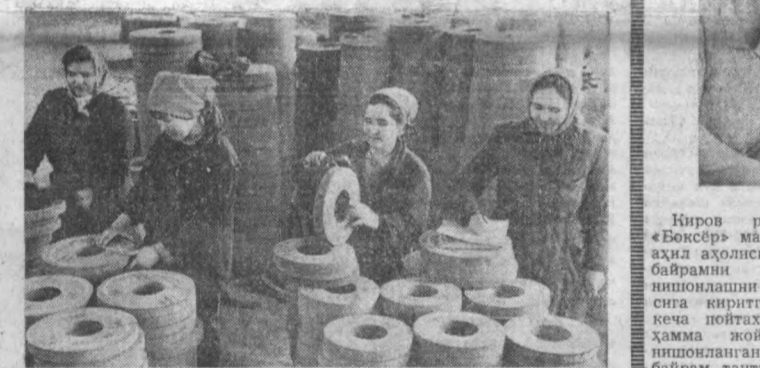
Шаҳримиздаги абразив комбинати шу неча-кундузда мамлакатимиздаги кўпгина машинасозлик корхоналарига ўзининг сифатли маҳсулотларини етказиб берибди. Ишлаб чиқарилган маҳсулотлар контеинерларда зудлик билан жўнатилиб турибди.

булиши учун курашадилар. Кўни кеча контеинерларга жойлаштирилган 63 та шундай трактор завод темир йўлида вагонларга ортди. Бу катта карвон олдиди кўбалик дўстларимиз пахтазорларида жавлон уради.