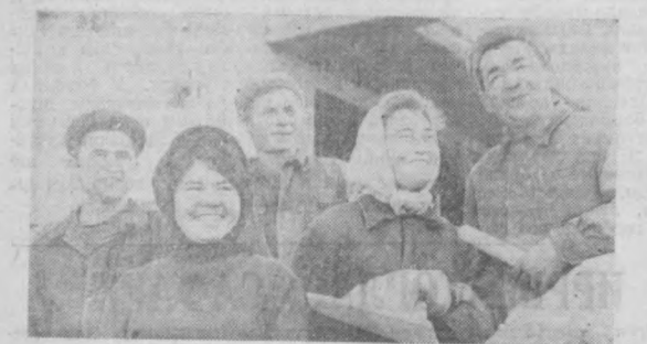
Шахримиз марказидаги марказий кинолекторий ҳам кўп ўтмай ишга тушади. Ҳозир бу ерда пардозлаш ишлари қилинган бўлибди. Энг сунги ва асосий пардозлаш ишларини «Отделстрой» тринистро қарашли 20-қўриқли бошқармасининг буюмкорлари олиб бормоқдалар.