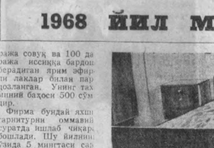
Мана бу тиройли хонтахта ҳам «Шарқ» фирмаси мебельсозларининг ишларидан намунадир.