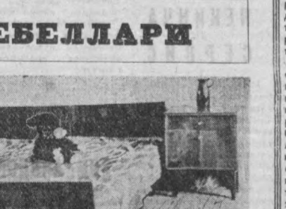
Тошкентдаги «Шарқ» термаси Москвадаги Бутуниттифоқ мебель маҳсулотларини ишлаб чиқара бошлади. Янги гарнитур шифонери, иккита бир кишилик кроват ва унинг олдига қўйилган кўти ва бошқа жиҳозлардан иборат.

Мебелларнинг бу термаси Москвадаги Бутуниттифоқ мебель маҳсулотларини ишлаб чиқара бошлади. Янги гарнитур шифонери, иккита бир кишилик кроват ва унинг олдига қўйилган кўти ва бошқа жиҳозлардан иборат. Мебеллар 120 да