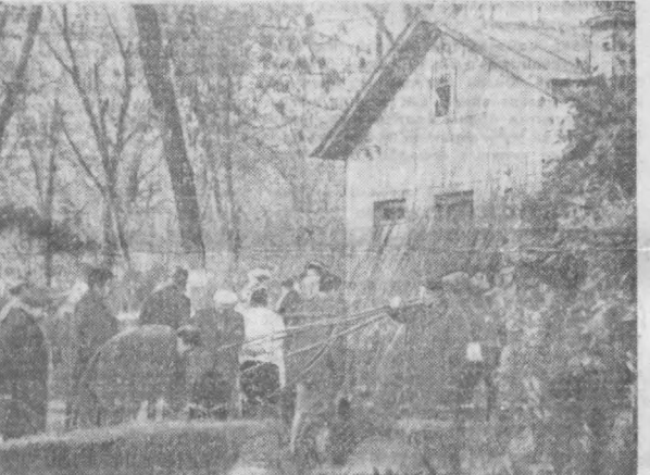
«Тошкент гуллари» фирмасига қарашли 1-гул мағазини шаҳарликларга кўнрақва хилма-хил мевали кўчатлар етказиб бермоқда. Бу ерда ҳар кун 300—600 туп мевали ва манзарали кўчатлар сотилмоқда.

«Машинастроитель» заводи кўп лухсали газетасининг ходими.