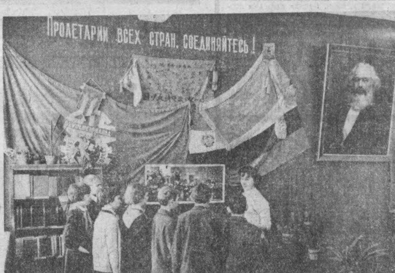
СУРАТДА: Музейнинг жамоатчилик бўйича директори Наташа Спасицева бир гуруҳ экскурсиячилар билан бирга чет эллик дўстлар томонидан совға қилинган байроқлар стендида.

Шу кўнлари ҳар бир районда мактаб ба-дий ҳаваскорларини иқиди қўриқ. Тоққиз инқодорларни, дастав-қаси, ҳақиқатнослиқни ишлар бўлиб таъриқ-конкурслар бўлиб ўт-моқда. Ветеранлар ва шахримизнинг донгдор кишилари ўқувчилар меҳмонли бўлишди.