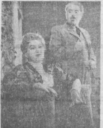
ҚОЗОН. Мамланатдаги энг кеңса театрлардан бири Галиасгар Камол номи Татаристон Академик театри коллективи М. Горький тугилган кунининг юз йиллигига бағишлаб йезуачининг «Душманлар» асарини сахналаштирди.