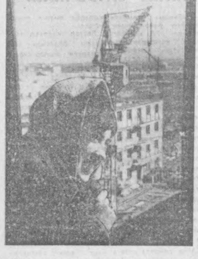
Шахар марказида тошенткилар учун шином уй-жойлар кураётган қарош унрамлиқ бинорлар орасида донеклиқ ирчанчи Людмила Криль ҳам бор. Бинорлар бу меҳнатсевар қизининг номини хурмат билан тилга оладилар. СУРАТДА: Людмила Криль.

Эқскурсоводлар учинчи қават деразаларига ҳақимнинг алоқиде эътиборини тортидилар. В. И. Лениннинг кабинети ва каартираси, кенг ёруз зал мана шу қаватда жойлашган. Совет ҳукумати Петрограддан Москвага кўчиб келгач, Халқ Комиссарлари Советининг мажлислари шу залда ўтказилар эди. Бундан 50 йил аввал 1918 йил март ойида шу залда Халқ Комиссарлари Советининг биринчи мажлиси бўлди. Мақлиса Владимир Ильич Ленин рақбарлик қилди. Муҳим ташкилий масалалар — ҳукуматдан чиқиб кетган «сўла» эсерлар ва «сўла» коммунистлар ўрнига халқ комиссарлари тайинлаш масаласи, Москвадаги буржуа матбуоти большевиклар партиясига ва совет ҳукумига қарши қабий тухмат кампаниси олиб бораётганлиғи сабабли бу матбуотни ёпиб қўйиш масаласи муҳокама қилинди. Халқ Комиссарлари Советининг мажлислари деврли ҳар ҳафтада бўлиб турарди. Бу мажлисларда ташқи савдои национализация қилиш, темир йўллари боқаршини марказлаштириш, Москва ва Петроград саноатини электрлаштириш, Туркистонда сугориш ишлари, қанд саноатини тиклаш ва бошқа кўнгна шу каби муҳим проблемалар кўриб чиқилар эди. Халқ Комиссарлари Советининг мажлисларига Ленин рақбарлик қиларди. Халқ Комиссарлари Совети ва унинг раиси В. И. Ленин фаолиятини А. В. Луначарский жузда жонли қилиб тасвирлаб берган. Бунде «қандайдир кўюқ қаёғиёт ҳукми сурарди, ҳар бир дақиқа шу қадар кўп