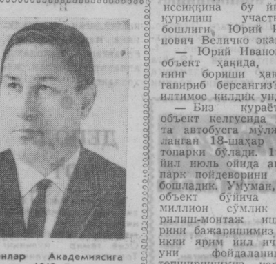
Фанлар Академиясига мухбир аъзо, 1960 йилда эса, ҳақиқий аъзо бўлиб сайланди.

1955 йили Ф. О. Мавлонов Москвада «Урта Осиёнинг марказий ва жанубий қисмларидаги соз тупроқ ва соз тупроқсим жинсларнинг генетик типлари» деган темада докторлик диссертациясини ёқлади. 1956 йили у Республика