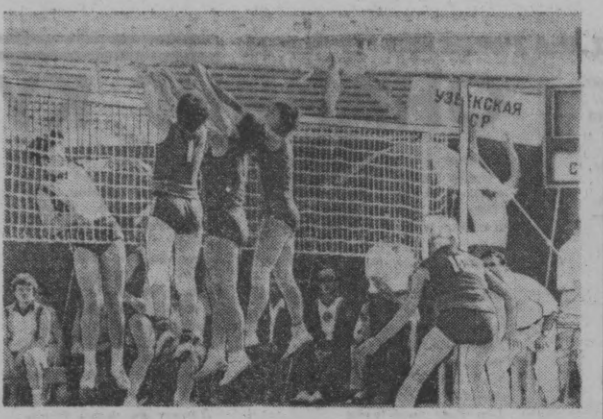
Москва, «Динамо» стадионида СССР халқлари юбилей спартакиадаси программасига кирган волейбол мусобақалари бошланди. Ҳозирги кунда саралаш уйлари бўлиб ўтмоқда. Белоруссия ва Узбекистон терма ко- мандалари учрашуви 3:2 ҳисобида белорус спортчилари фойдасига ҳал бўлди.

Бухарест шаҳрида ўт- казилган халқаро тради- цион мусобақаларда Совет Иттифоқининг медаллари ва биринчи ўринга кўтарилиди. «Динамо» спорт жамия- тлари спортчилардан ташкил топган ва фе- дацияга социалистик- амалкаш динамовчилар ўрнини ўзгартиришга мажбур бўлишди.