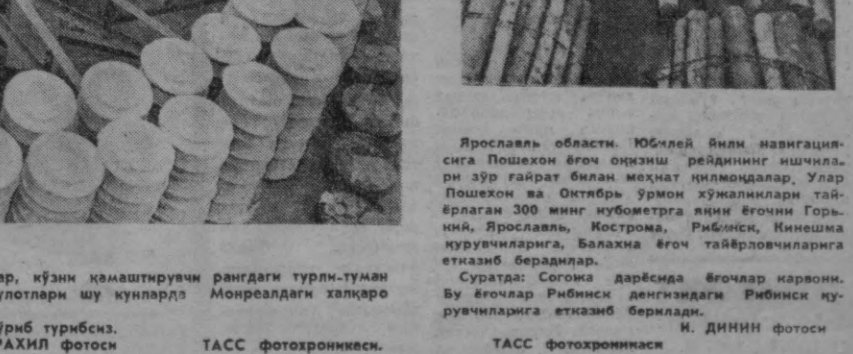
Ю. РАХИЛ ФОТОСИ

Депутатлар 1967 йил, 25 июль соат 8 да уша ерда ҳисовга олинадилар.