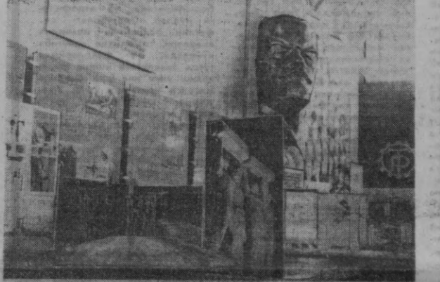
Суратда: ВДНХ залида.

«Ўзбекфильм» киностудияси Улуғ Октябрнинг шонли эрми эркин тўғрисида қандай ижодий армуғонлар хоҳларди? Бу савол аяббатта кинотомошабинларни кўпроқ қизиқтиради. Юбилей йили фильмларини билмоқчи бў-