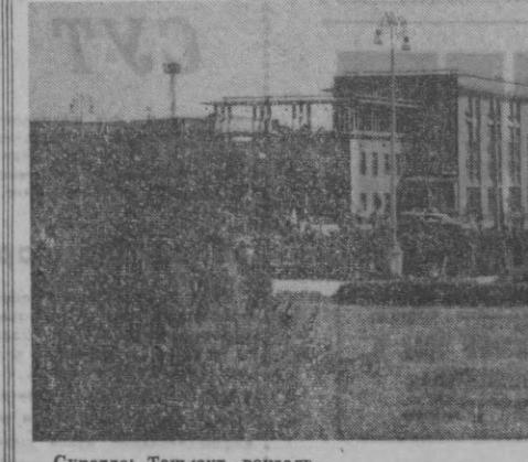
Суратда: Тошкент вокзали.

8 МАИ. В. И. Ленин номи Тошкент олий умум қўшни қўмондонлари билим юртида шу ўқув юртида таълим олиб, Ватан учун бў- лув жингларида жон фидо қилган даҳрамоно- лар шарафига унрайдиган Шош-шўхрат обелиски- ни «ошиқли» маросими бўлди. 12 МАИ. Тошкентда сув иситиш гелиоуста- новкаларидан фойдаланишдаги таъмирбалди алмашишга бағиш- ланган Бутунитти- фок кенгаши бўлиб ўтди. 25 ИЮЛЬ, 1967 й.