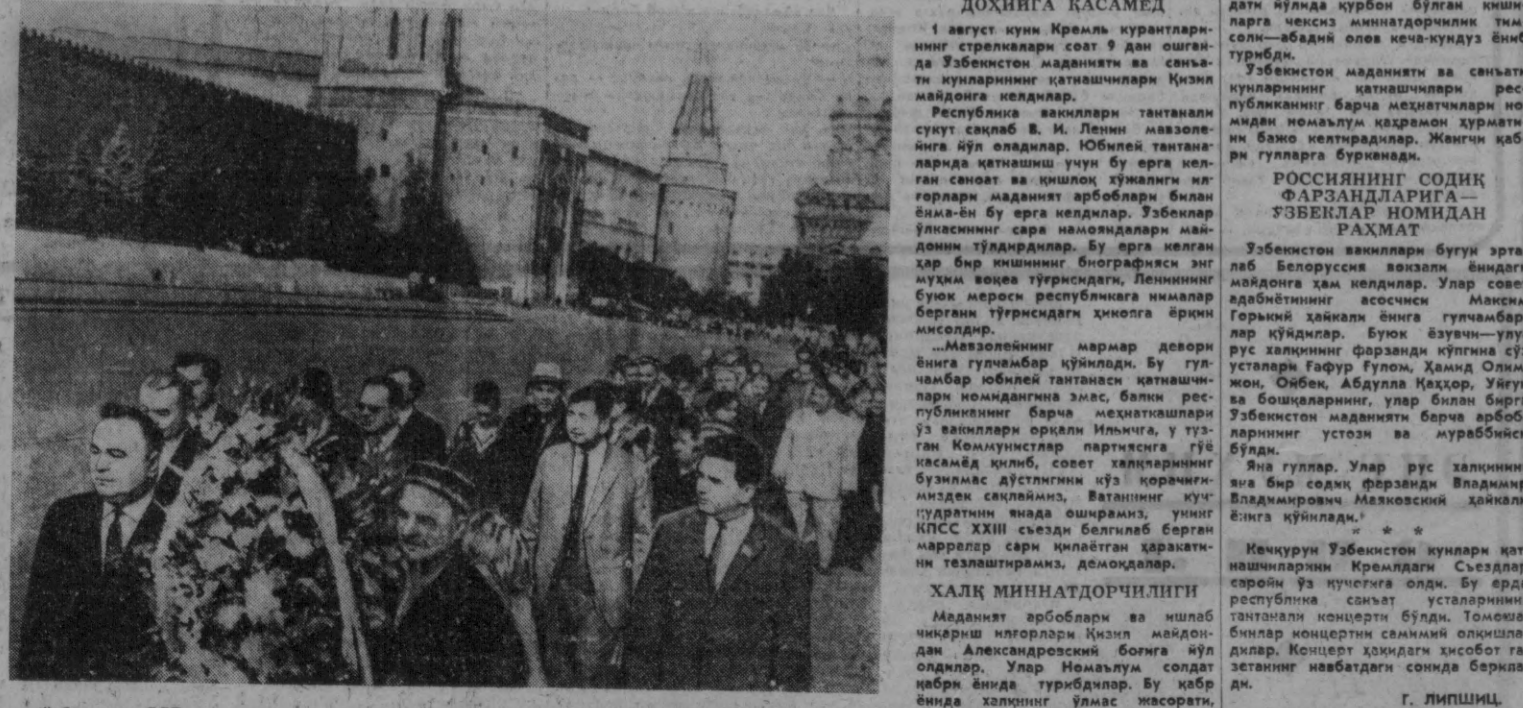
Ўзбекистон ССР маданияти ва санъати кўпчилиги Москвада ўзбекистон кўпчилиги ва санъати кўпчилиги билан танишди.