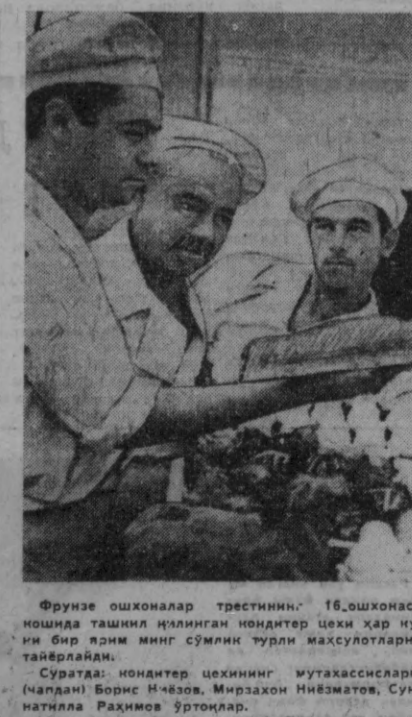
Фрунзе ошхоналар трестининг 16-ошхонаси ношида ташкил қилинган нондиртер цехи ҳар ну...

Теннис столида бўлиб ўтган мусобақалар бир қанча уста теннисчиларни аниқлаб берди. Умумкомандалар орасида иккинчи отряд теннисчилари биринчи ўринни эгаллашди.