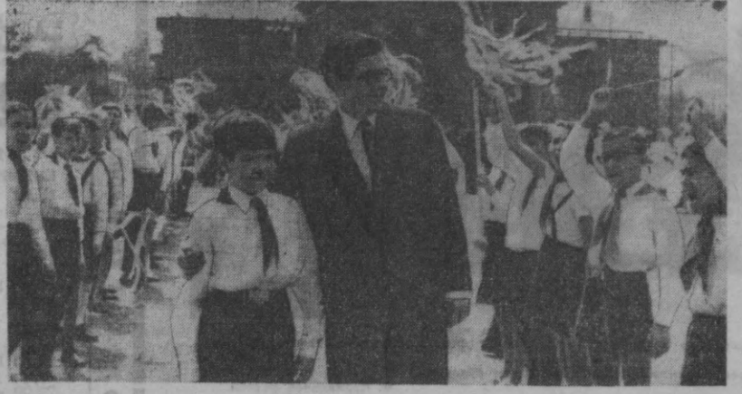
Венгриянинг «Ота» фильмидан кадр. Москвадаги 5-Халқаро кинофестивалда бу фильм «Қатта соврун» билан тақдирланди.

1956 йилда уч давлат Мисрда агрессия бошлагандан сўнг Совет Иттифоқи араб мамлакатларига нисбатан ўз сийосатини яна бир бор таъдилди.