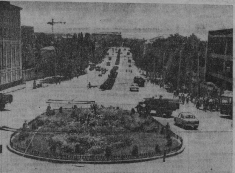
Шаҳримизнинг кўрки кун сайин яхшиланиб бормоқда. Суратда: Калинин майдонининг Ҳамза кўчасидан кўриниши.

Яшаб, яшнаб тинглайвер, Эй Ватан, она замин! Тонгда ишга йўл олар, Меҳнатнашлар надами!