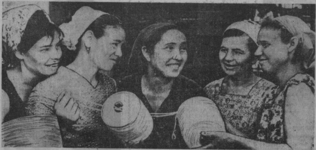
«Учкун» фирмасининг ишчилари Улуғ Октябрнинг 50 йиллигини муносиб қутиб олиш учун социалистик мусобақага қўшилиб, меҳнат ваҳтасида туриб ишлаётдилар.

ЎЗБЕКИСТОН КП ТОШКЕНТ ШАҲАР КОМИТЕТИ ВА ТОШКЕНТ ШАҲАР СОВЕТИНИНГ ОРГАНИ