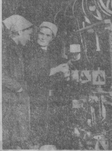
Ўзбекистон ССР Энергетика ва электрлаштириш министрлигида қарашли икхтослаштирилган ремонт-ишлаб чиқариш корхонасида беш йиллик илгорлари кўри.

Шундан кейин билим даргоҳининг юқори синф ўқувчилари ташкил қилган «Носмос» ҳамда «Электрон» командалари ўртасида физика фанига оид ўттир зеҳинлар мушоираси ўтказилди.