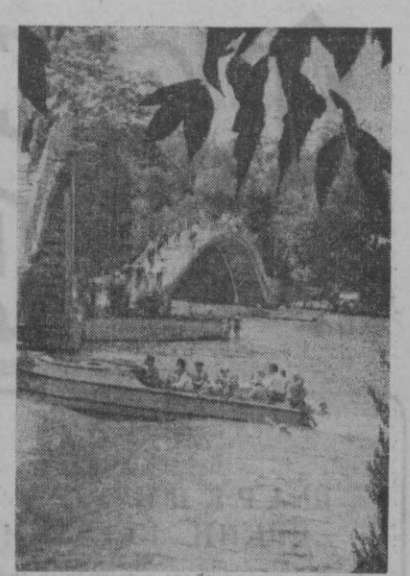
Тошкентдаги комсомол кўлида.