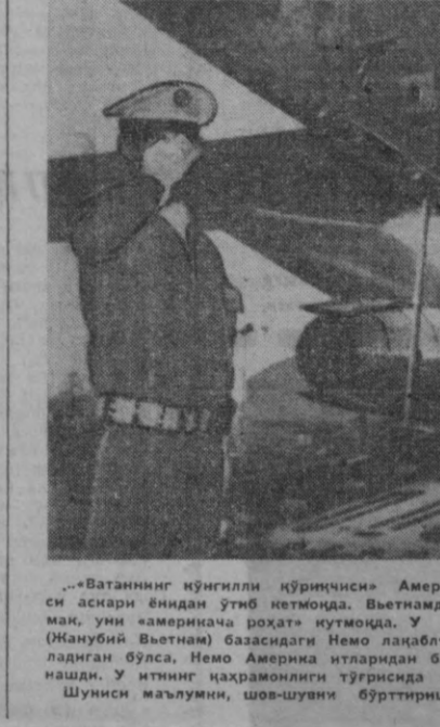
«Ватанинг кўнгли кўричиси» Америка ҳарбий-ҳаво кучларининг Калифорниядаги базаси аскари ёнидан ўтди...