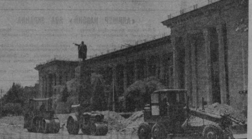
В. И. Ленин майдонининг реконструкция қилиниши.