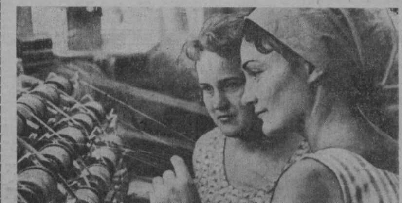
Пойтахтдаги «Учқун» тикувчилик фирмасининг коллективи Совет ҳокиимиятининг 50 йиллигини меҳнатда ната зарфарлар билан кутиб олмақда.

Этган қувноқлар Тошкентнинг тарихий жойлари бўйлаб экскурсияга чиққилар.