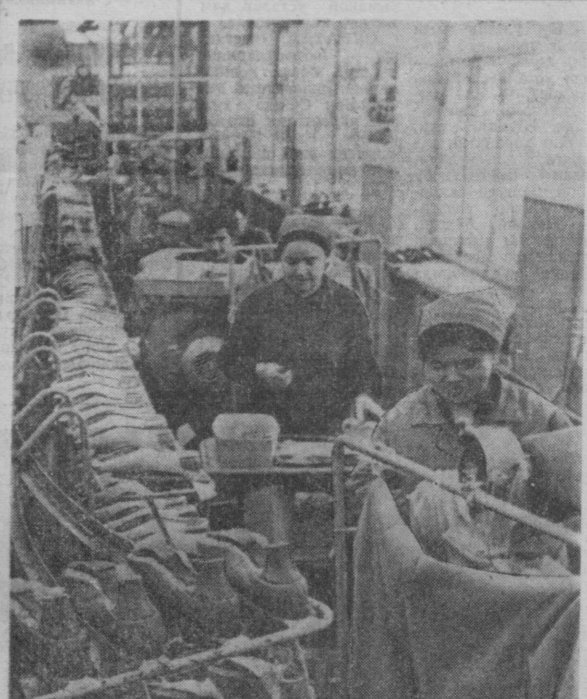
Шаҳримиздаги 2-пайфазал фабрикаси баҳорги ва ёзи мавсум учун кўплаб турли хил эриак ва аёллар пайфазалларини ишлаб чиқармоқда.

Утган йили заводнинг 147 ишчи-хизматчиси ички ишлар органлари томонидан ушланди. Шу йилнинг январь-февраль ойларида эса, ун бир киши жамғомчилик терибини бузганлиги учун жазоланди.