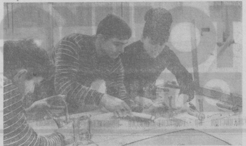
В. И. Ленин номи музейни бунёд этишда қардош Венгрия халқ Республикасидан келган монтажчилар ҳам фаол иштирок этмоқдалар.

Митетини ҳузуридаги бош архитектура-планилаштириш, капитал қурилиш бошқармалари, «Главлташкестрой» турар-жой массивлари, саноат объектлари пойтахтнинг тузиш ва қурилиш вақтида спорт иншоотларини қурилиш белгиланган нормативга мувофиқ бўлишини таъминлашга мажбурдирлар.