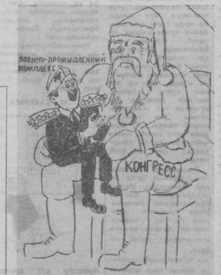
Очофат гўдак.