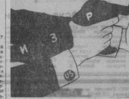
Жаҳон империализмининг курули. [Карикатура «Ойленшгиль»] [ГДР] журналдан олинган.