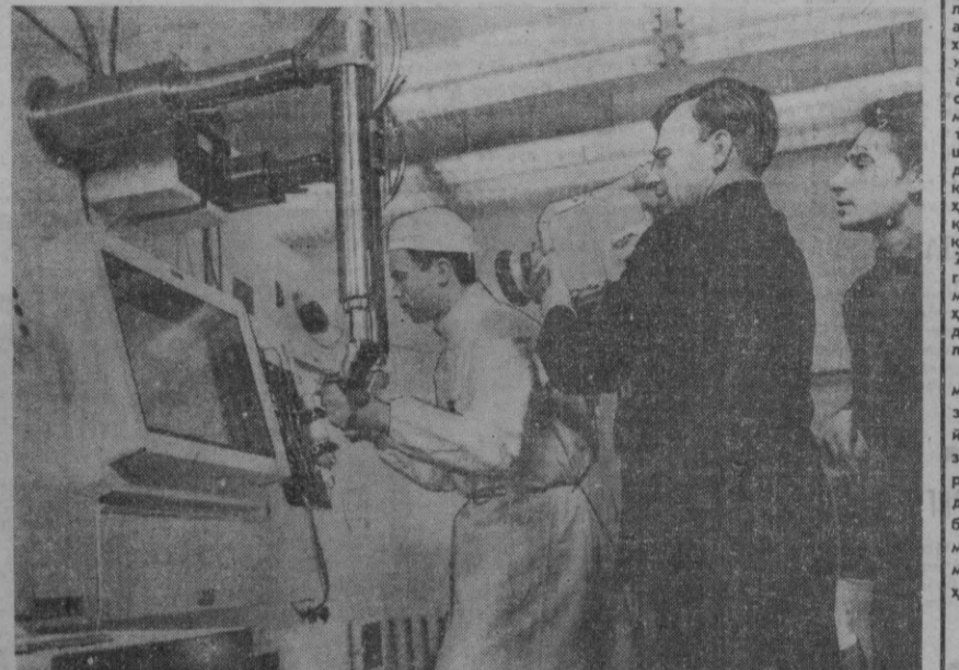
Марказий ҳужжатли фильмлар студияси Совет ҳокимиятининг 50 йиллигига кенг формати тўла метражи «Менинг Ватаним» рангли фильмининг чикаради. Фильмининг «Фан» бўлими...