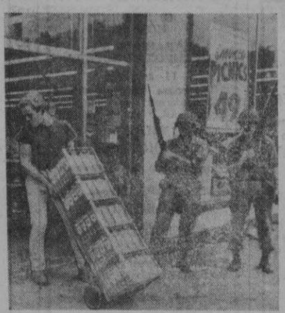
АҚШ. Америка агентликларининг хабар қи-лишларича, «новш» бўлиб қолган Детройтда шаҳардан парашотчи қисмлари олиб чиқиш бошланди. Аммо у ерда ҳамон илгаридек 3000 га яқин парашотчи ва 700 га яқин штат ҳамда полиция ишчилари қолмоқда.

Суратда: ҳарбий гардия асарларни ва сут ташувчи Детройт иқтисоди.