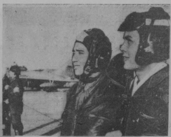
ВЬЕТНАМ ДЕМОКРАТИК РЕСПУБЛИКАСИ, Вьетнам халқ Армияси учувчилари ҳавога кўтарилиш олдидан.