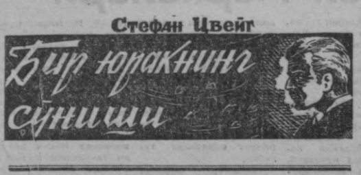
Стефан Цвейг Бир юракнинг сунниши