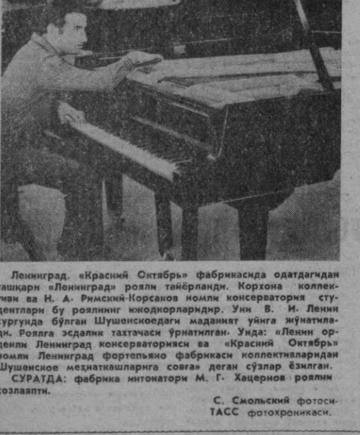
Ленинград «Красный Октябрь» фабрикасида одатдагидан таъқари «Ленинград»...