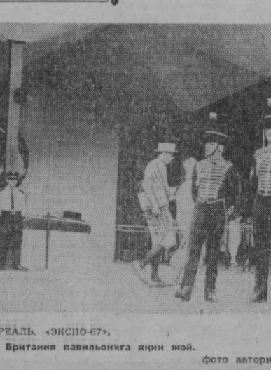
МОНРЕАЛЬ. «ЭКСПО-67». Буюк Британия павильонига яқин жой.