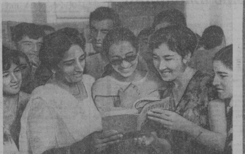
Ҳиндистонли санъаткорлар Санъат саройида бир гурпа шаҳар ёшлари билан суҳбатлашаётган ва уларга эсадин автографлари қолдираётганлар.