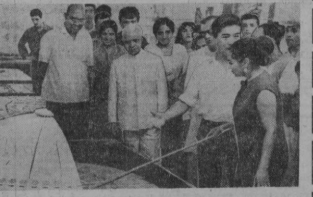
Шаҳаримизда Ҳиндистон мадани яти денгаси катта муваффақият билан ўтмоқда. Кунни кеча Куйибоси...

Кўп яшасин, Советларнинг туллаган баҳорлари! Шалов-ю чамшалари, дор ва анхорлари!