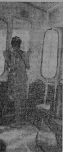
Охириги тўхташ ёрнда.