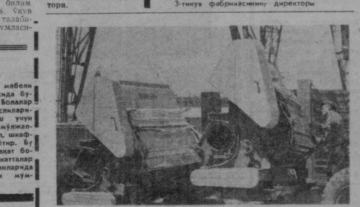
«Ўзбекхлопкомаш» заводининг коллективи пахта тозалаш санатини учун турли туман замонавий машиналар таёрланмоқда. Суратда: завод ҳовлисида янги механизмлар жўнатилга таёрланмоқда.

В Д Р ТА Ш Қ И И Ш Л А Р МИНИСТРЛИГИНИНГ БАЁНОТИ ХАНОЙ. (ТАСС). Вьетнам Демократик Республикаси ташқи ишлар министрлиги баёнот қилди. Баёнотда Қўшма Штатлар Ханой шаҳри уй-жой кварталларига яна ҳаводан ваҳшиёна ҳужум қилётганлиги учун кескин қораланади. 1967 йилнинг 21, 22, 23 августда, дейлади ВИА агентлиги томонидан эълон қилинган баёнотда, Америка самолётлари Вьетнам Демократик Республикасининг пойтахти — Ханой марказидаги ва шахар атрофидаги бир қанча аҳоли яшайдиган районларни ва иктисодий объектларни жуде қаттиқ бомбардировка қилди. Улар касалхоналарни, синоат корхоналарини ва шахар марказидаги аҳоли энг кўп яшайдиган кўчаларни бомбардировка қилди. Юздан ортиқ граждан ўларидилди ва ярадор қилинди. Ибодатхона ва бош собор, шикастланди. Шундай қилиб, икки хафтадан кезроқ вақт ичида Америка самолётлари Вьетнам Демократик Республикаси пойтахтин беш