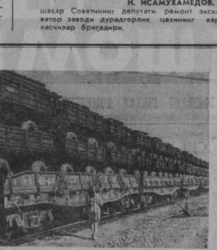
«Ташавтомаш» заводининг маҳсулотлари юланмоқда. Деярли ҳар куни завод ҳовлисига прицеплар вагонлар келиб, мамлакатимизнинг колхоз ва совхозларига тайёр маҳсулотларни олиб кетади.

«Ташсельмаш» «ХТ-1,2» машиналарининг иш муддатини кўпайтирадигар. Жумладан, трактор-йигув заводи ўтган йилдаги нисбатан 11 процент кўп трактор (ҳаммаси бўлиб 20 минг дона) тайёрлаб беради. «Ташавтомаш» ўн процент кўп трактор прицеплари тайёрлаб беришга аҳд қилган. Корхоналар янги меҳнатчиларни, шу жумладан ўзгача ишлов берувчи комплекс машиналарни сериали ишлаб чиқаришни ўзлаштирилди. «Ўзбексельмаш» заводи январь — май ойларининг ўзиде 2537 сеялка, 225 та гербицидларни далага чиқаришга асқинга тайёрлаб берди. Бу чигит экинчи ўз вақтида ўтқазиб имкониятини бериб. «Ташсельмаш» заводи ишлаб чиқаришни кайта ташкил этиб, ҳозиринда ўзиде «17-ХВ» маркази кенг қаторли пахта терши машиналаридан мингтасини ишлаб чиқарди. Бу йил пахтакорлар шаҳримизнинг қишлоқ хўжалик машинасозлиги қорхоналаридан биринчи марта кўп миқдорда ўнқилган пахтакорларни теруши янада мукамал машиналарни оладилар. Бу маши-