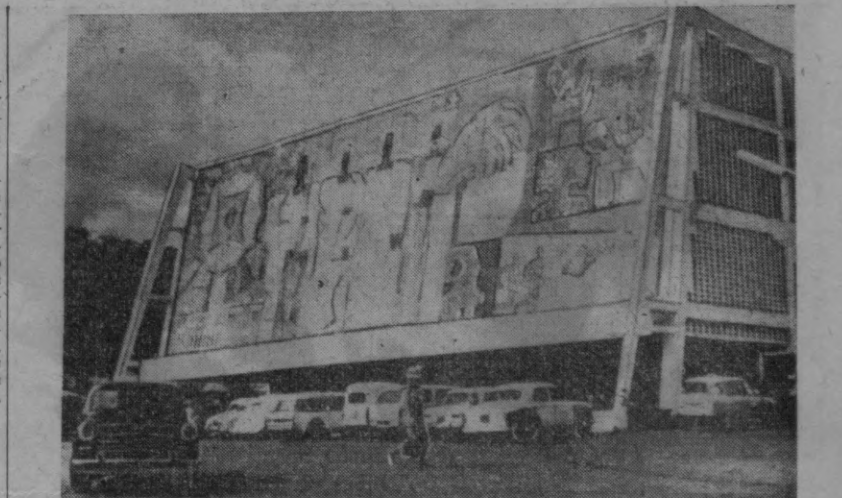
Бамано. Мали Республикасининг пойтахтида Совет Иттифоқи ердами билан ҳозирги замон типидидаги спорт комплекси қурилади. Бу ерда гандбол, баскетбол ва бошқа уйинлар учун 1400 ўринли зал, стадион ва сузиш ҳавзаси бор. Суратда: 1400 ўринли спорт залини кўриб турибсиз.

Марказий ҳуқумат вакили умуман ҳарбий аҳволини характерлаб, сунгги бир неча кун ичида федерал қуролли кучлар барча фронтларда анча олдинга силжиганлигини айтди.