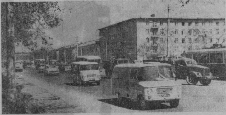
БУГУНГИ ТОШКЕНТ СУРАТДА: Шота Густавели кўчасининг кўришиши.