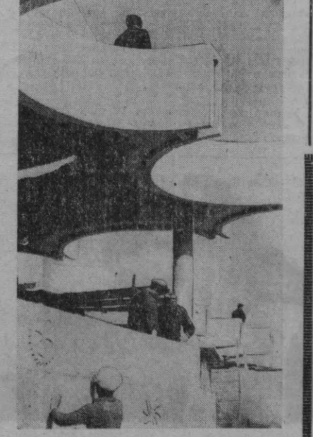
Ленин хибобинида маданият-маншнӣ объектлар қурилиши жадал бормоқда.

Студентлар шаҳарчаси катта ҳашар майдонига айланган. В. И. Ленин номи Давлат университетида икки миш йилгит-қиз, Политехника, Физкультура, ҳамда Чет тиллар институтларидан қарийб уч миш студент шаҳарчани ободлаштириш ва кўкамлаштирашда қатнашди. Яқшанбаликка чиққан студентлар ариқларини, хибобларини, физкультура майдонларини тартибга солишди, ётоқхоналарини яхшилаб жиҳозлашди, гулзорларини чопиб ҳар хил гуллар экишди. Олча, олхўри, ўрик, олма каби мевали дарахтлар ҳамда манзарали дарахтлардан 10 миш туп кўчат ўтказишди.