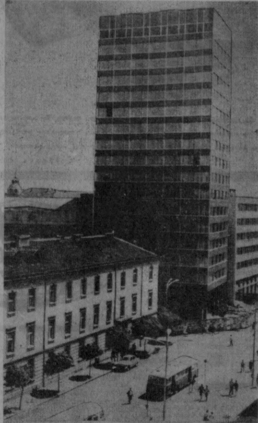
Болгария Халқ Республикасининг пойтахти — Софиядаги 18 қаватли бино. ВНА-ТАСС фотоси.

Бу галги кенгаши — Исроия агрессияси оқибатларини тугатиш ва Исроияга нисбатан бўлдиғай бундан кейинги сиёсатини аниқлаш ашига муҳим ҳисса бўлиб қўшилди. Юксак даражада ўтказилётган кенгашининг ташқи ишлар мианстрлари томондан тайёрланган кун тартиби агрессия оқибатларини тезроқ тугатишга қаратилган сиёсий, иқтисодий ва ҳарбий базаларини тугатиш, Исроия агрессияси вақтида араб халқига нисбатан душманлик позициясини тутган фарб мамлакатларига араб нефтини етказиб беришни тақдирлаш сиёсатини қўлланш ва шу каби муҳим масалаларни ўз ичига олган.