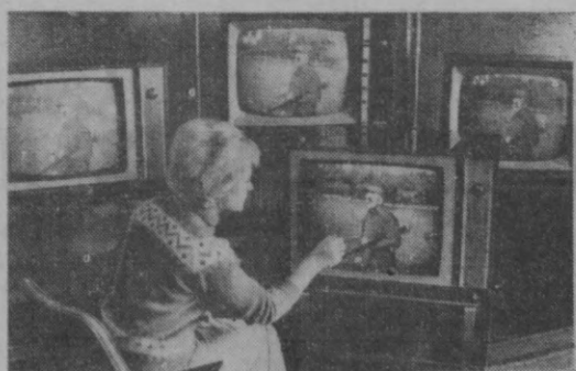
Москва телевизор заводи рангли «Рубин-401» номли телевизорлар ишлаб чиқара бошлади.

6 СЕНТЯБРДА БИРИНЧИ ПРОГРАММА 17.55 Эшиттиришлар программаси. 18.00 Теленгилликлар.