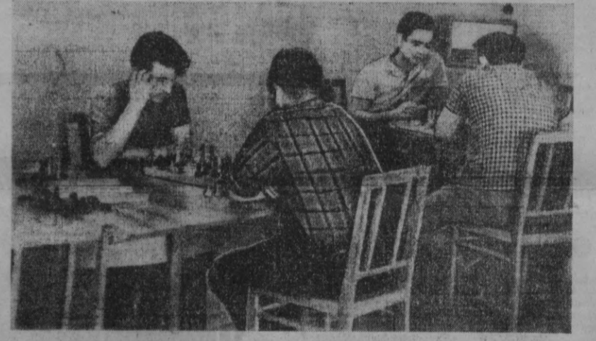
Ўзбекистон ССР эриқ-овқат министрлигига қарашли Тошкентдаги таъриба механика заводи ишчилари клубининг қизил бурчаги ишчиларнинг дам олиш соатларида жуда гаъжум бўлади. Бу ерда ишчилар шахмат ўйнайдилар, газета-журналларнинг янги сонлари билан танишиб, радио тинглайдилар.