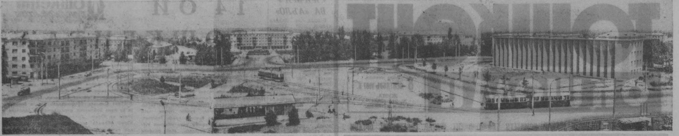
Суратда: Оқтепа турар жой массивининг кўриниши.