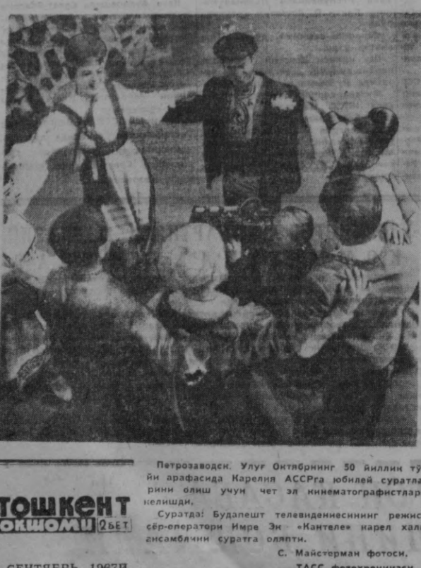
Патрозовден. Улуғ Октябрнинг 50 йиллик тўйи арафасида Карелия АССРга юбилей суратларини олиш учун чет эл кинематографистлари келиши.

Харбий инсон узок ва қаримай яшашни керакли Халқ ўртасида шундай дейишади. Ҳақиқатан ҳам узок вақт соғлом ва қаримай яшашни қандай яхши қарган чоғда ҳам эш ва баууват, танибидан, маъиятга фойдаси тегадиган, билимдан, ҳурматга сазовор одам бўлишга ҳаракат қилиш мақсада мувофиқ.