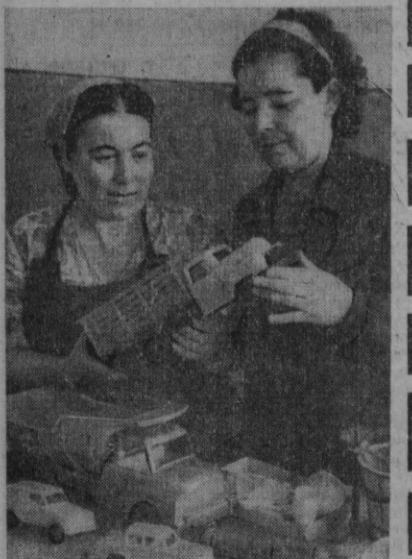
Тошкент пластмасса буюмлари заводи фахат биринчи машинасини корхоналари учунгина махсус ўтказиб чиқариш билан чекланмай, балки аҳоли ушбу кенг истеъмол молларининг айрим турларини ишлаб чиқаришни ҳам кенг йўлга қўйган.

Гафур Ғуллом номли Тошкент Давлат бадиий адабиёт наشريети талантилиб Абдулла Қаҳҳор туғилган кунга 60 йил ўтганини муносабат билан унинг олтинчи томлик талпиқига асарларини нашр этганига иштирок этиди.