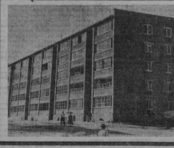
Эстониялик қурувчилар бунёд этган турар жой бинолари.