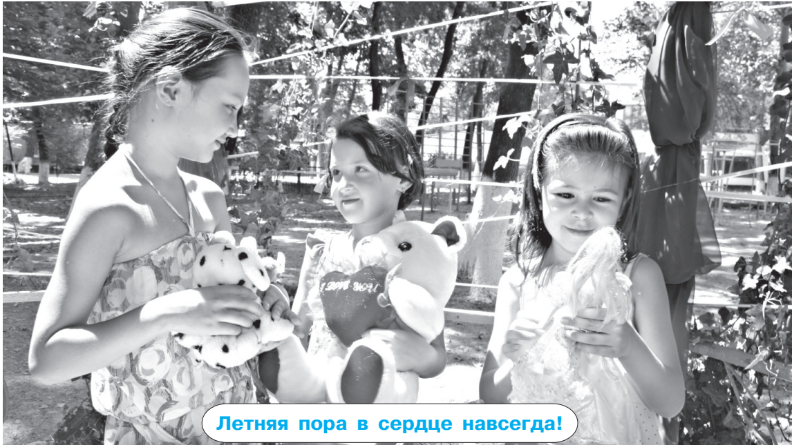
Летняя пора в сердце навсегда!