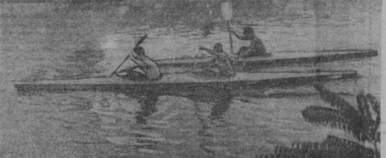
СУРАТДА: шахар сув спорт секциясининг спортчилари анҳорда машғулот ўтказмоқда.