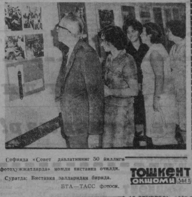
Софияда «Совет давлатининг 50 йиллиги» фотоэжватларда номли виставга очилди.

«Умумий бозор» норча, доллари Италия қанд экспортчиларга гаран-тия тарихида катта-гина мўмай пул — 200 миллиард лира ваъда қилдилар.